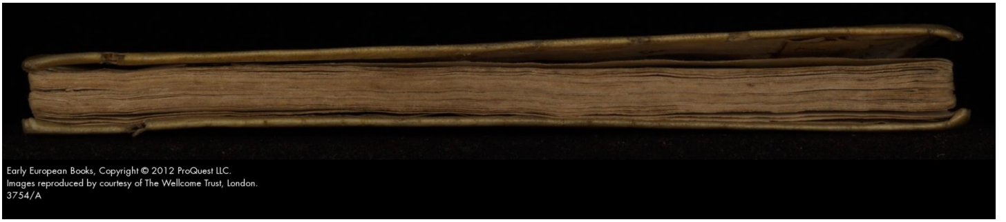
Early European Books, Copyright © 2012 ProQuest LLC. Images reproduced by courtesy of The Wellcome Trust, London. 3754/A